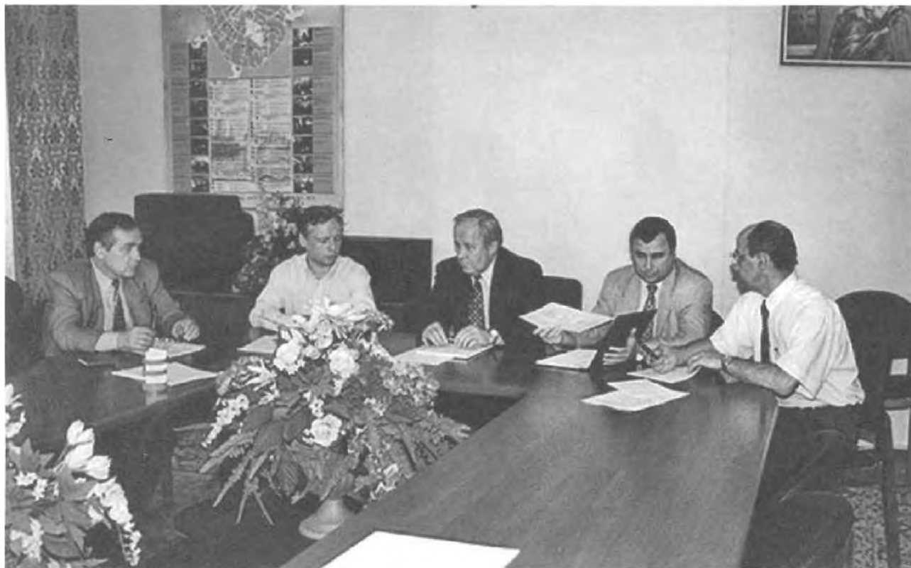
Совещание в Комитете труда и занятости Правительства Москвы по вопросам трудоустройства инвалидов. 1998

через синтезатор речи на слух) может принимать и передавать любую информацию во всех областях человеческого общения. Для инвалидов открылись новые горизонты.